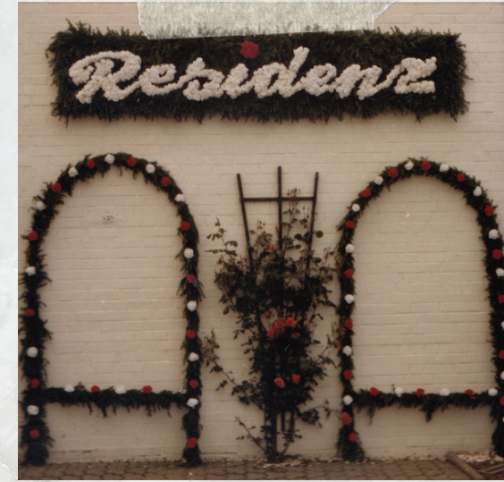
Der von einem unserer Nachbarn erstellte Schriftzug "Residenz", der in den folgenden Jahren noch einige Königshäuser geschmückt hat.