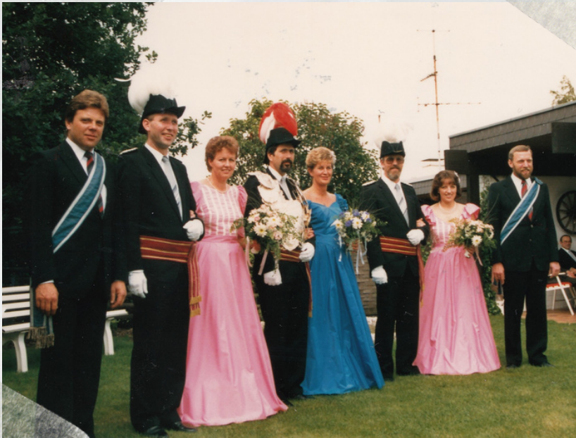
Der Hofstaat im Garten des Königs